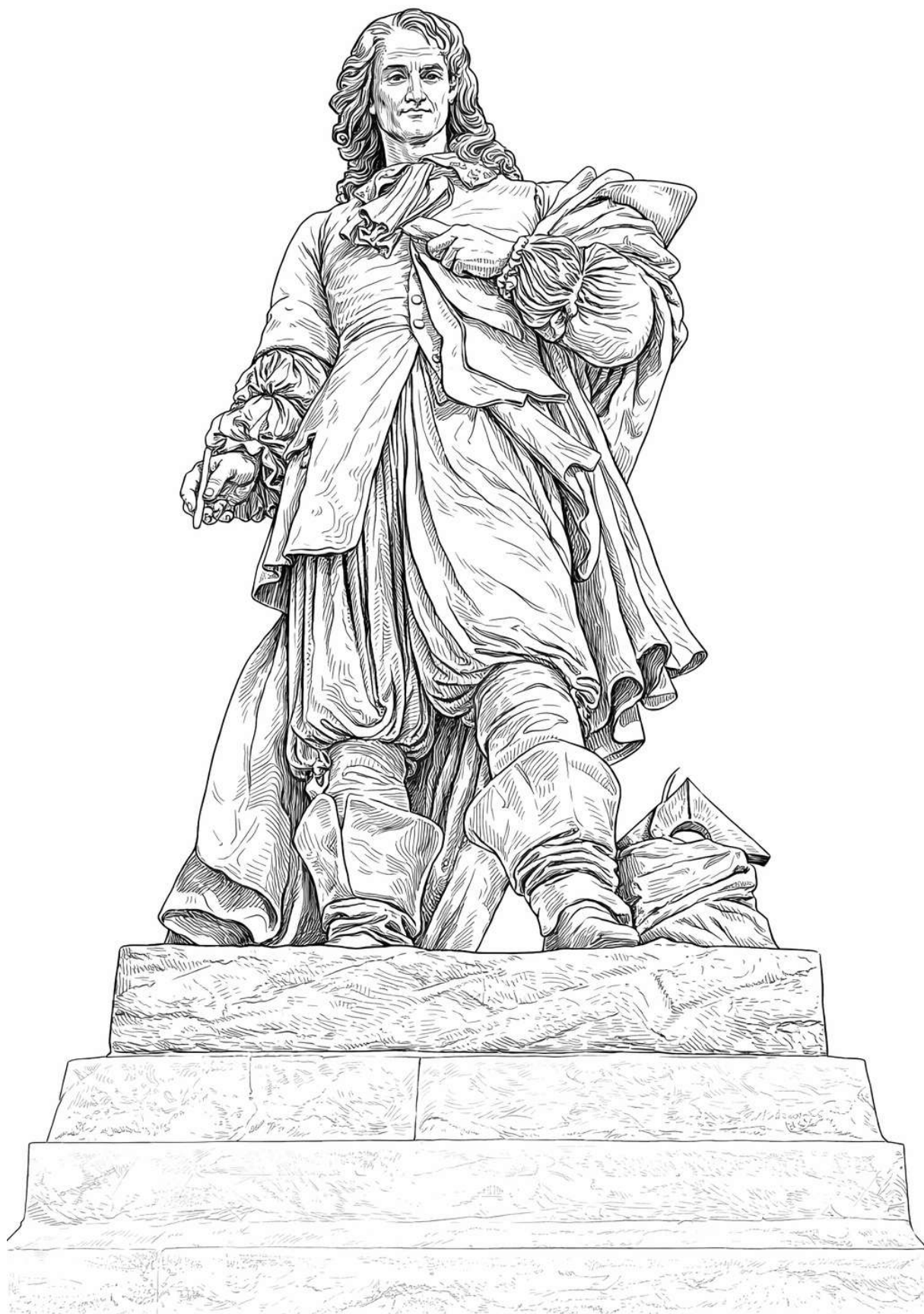
Coloriage statue Pierre Paul Riquet