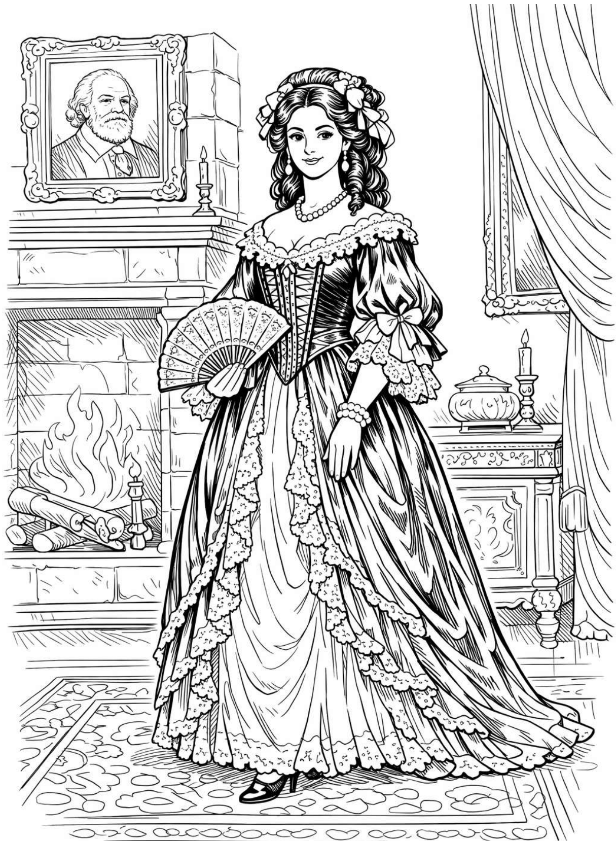
Coloriage vêtements de l'époque