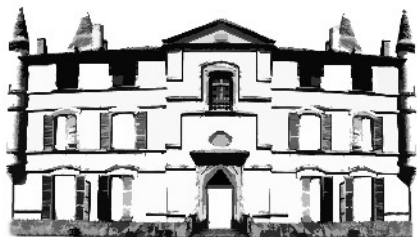
CHÂTEAU DE BONREPOS-RIQUET

Château de Bonrepos-Riquet En Mairie 31590 BONREPOS-RIQUET