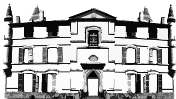
CHÂTEAU DE BONREPOS-RIQUET

Château de Bonrepos-Riquet En Mairie 31590 BONREPOS-RIQUET