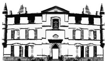
CHÂTEAU DE BONREPOS-RIQUET

Château de Bonrepos-Riquet En Mairie 31590 BONREPOS-RIQUET