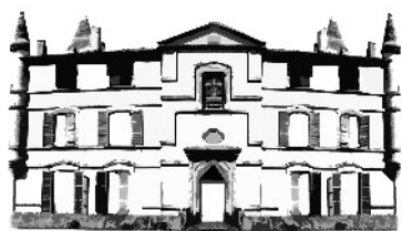
CHÂTEAU DE BONREPOS-RIQUET

Château de Bonrepos-Riquet En Mairie 31590 BONREPOS-RIQUET