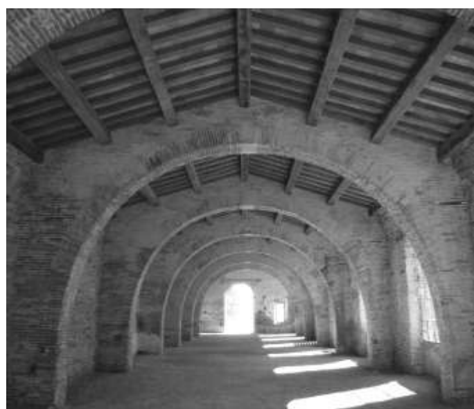
Orangerie pendant et après le chantier