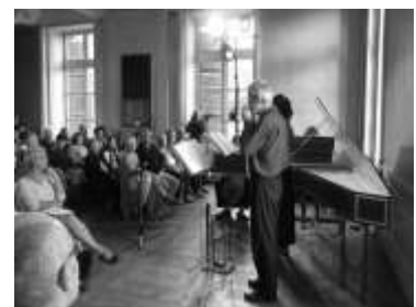
Journées du Patrimoine