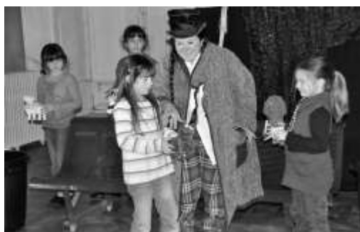
La représentation des enfants de Bonrepos