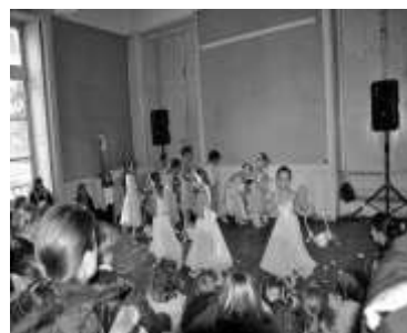
Journée des Jouets