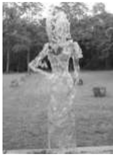
Dorothee était là

En cette année 2010, l'association a organisé les manifestations prévues :