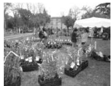
Journée des Plantes