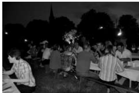
Le repas des voisins

Au fil des saisons le Foyer Rural Pierre Paul Riquet vous a comme chaque année proposé des activités aussi dynamiques qu'éclectiques.