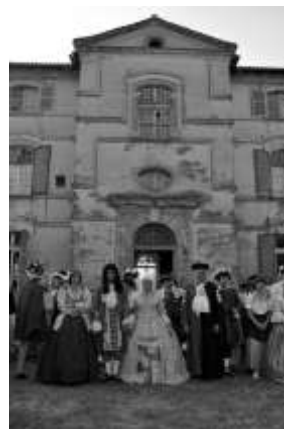
Festivités de Riquet